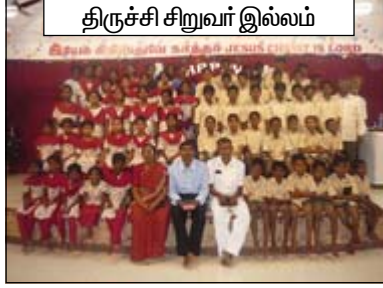
திருச்சி சிறுவர் இல்லம்