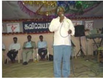
சகோ. ஆரோக்கியம் பாடல், சாட்சி