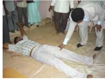
ஒவ்வொருவருக்காகவும் பாஸ்டர் மாற்கு கருத்தாய் ஜெபித்தார்கள்.