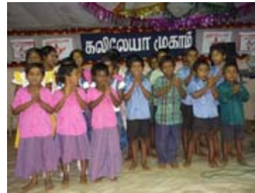
குண்டல் சிறுவர் இல்லப்பிள்ளைகள்