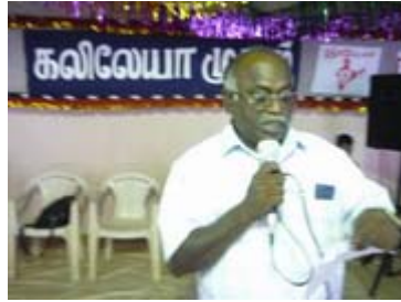
சகோ. பன்னீர் 100-கிராம சாட்சி