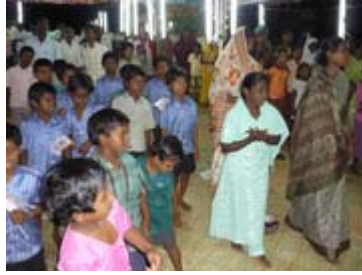
கூட்டத்தின் ஒரு பகுதி