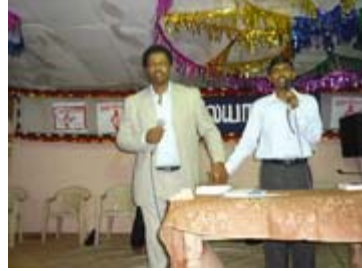
Pr. மாற்கு லூயிஸ் செய்தியளித்தல்