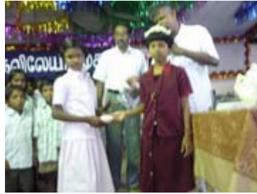
ஜிலிக்ஸி தின்பண்டம் வழங்குதல்