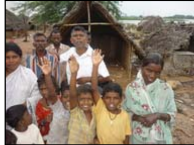
கடந்த மாதங்களில் பஞ்சப்பூரில் ஆராதித்து வரும் TVGM கூடாரம்.