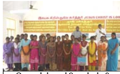
மெத்தெஸ்ட் உயர்நிலைப்பள்ளி நாட்டுநலப்பணி திட்ட மாணவிகள்