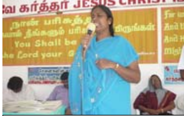
விக்டோரியா ஆசிரியை சாட்சியளித்தல்.