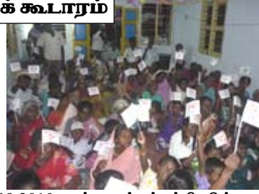
22.09.2010 அன்று பஞ்சப்பூர் பிரதிஷ்டை ஆராதனையில் பங்கேற்றவர்கள்.