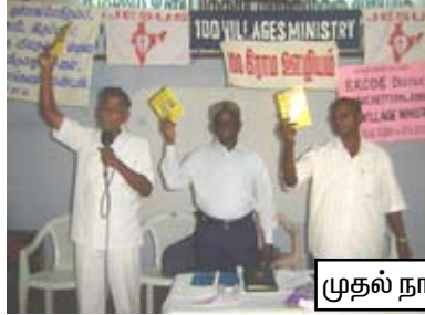
முதல் நாள் ஜெபத்தின்போது