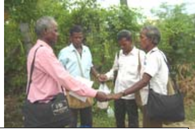
கிராம ஊழியர்கள் ஜெபத்துடன் கிராமங்களுக்குள் கடந்து செல்லுதல்