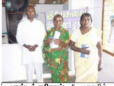
பாஸ்டர் எபிதாஸ் & முகாமில் கலந்துகொண்டவர்கள்.

கர்த்தருடைய கிருபையினால் 26.03.2011 அன்று நாகை மாவட்டம் – தேரிழந்தூர் – நல்லமேய்ப்பன் சபையில் இயேசுவை விருமபுவோர் முகாம் நடைபெற்றது.