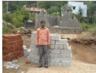
ஓட்டன்சத்திரம் அருகிலுள்ள பால்கடை கிராமத்தில் கட்டப்பட்டு வரும் ஜெபலீடு