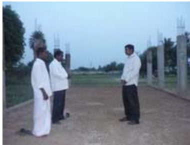
உத்திரமேரூர் யூனியனிலுள்ள கிழக்காடி கிராமத்தில் கட்டப்பட்டு வரும் ஜெபலீடு